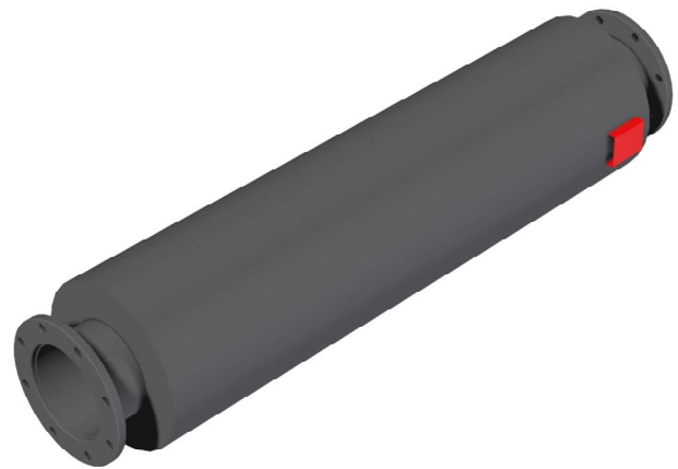
Tussenschakeldemping: (gemeten op een 6" systeem)

De drukval over de uitlaatgassendemper is afhankelijk van de uitlaatgassenhoeveelheid (stromingssnelheid) door de uitlaatgassendemper. Met behulp van onderstaande formule is de drukval eenvoudig uit te rekenen. Desgewenst kunnen wij u hierover nader informeren.